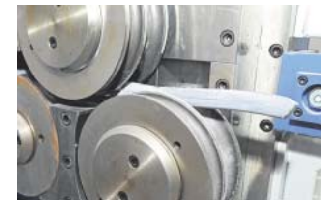
Der angespitzte Draht kommt am Ende zwei Millimeter dünner wieder aus der Maschine heraus.

50 Tonnen kann der Motor durch den Ziehstein ziehen. Doch die Kraft allein macht es nicht, erläutert Holger Falz. Es geht vielmehr um die Oberfläche. Genau darin liegt die Kunst eines Drahtziehers: Aus dickem Draht dünnen Draht eines genau bestimmten Durchmessers zu machen – ohne die Oberfläche zu zerstören. Je mehr rohe Kräfte walten, desto schwieriger wird das. Wie Claas das hinkriegt,