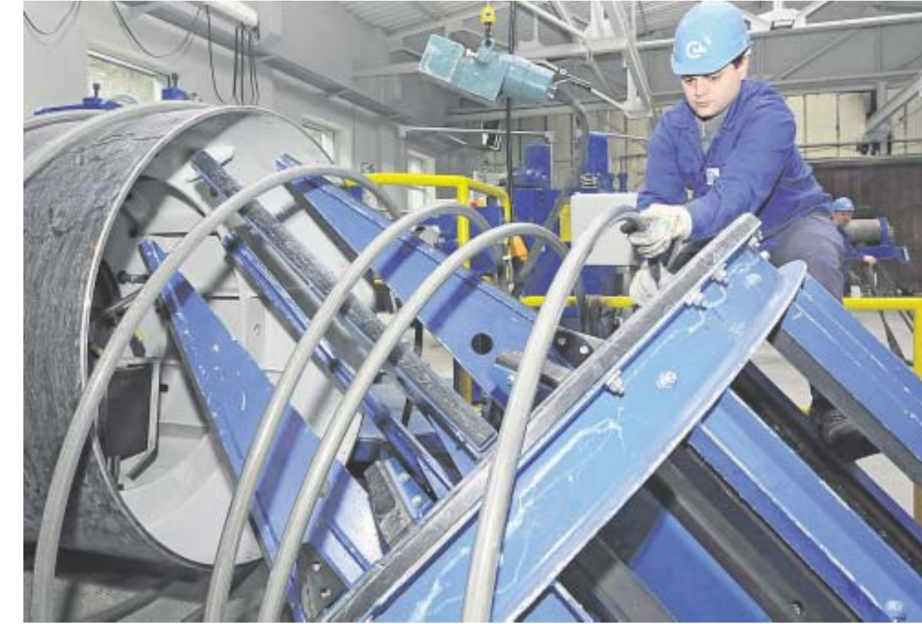
Seit drei Wochen läuft der Testbetrieb an der neuen einzigen Ziehmaschine am neuen Standort in Grünwiese. Bis zu 52 mm dicken Walzdraht können die Claas-Leute dort verarbeiten – bisher ein Alleinstellungsmerkmal in Deutschland.