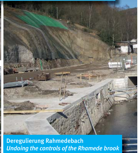
Deregulierung Rahmedebach Undoing the controls of the Rhamede brook