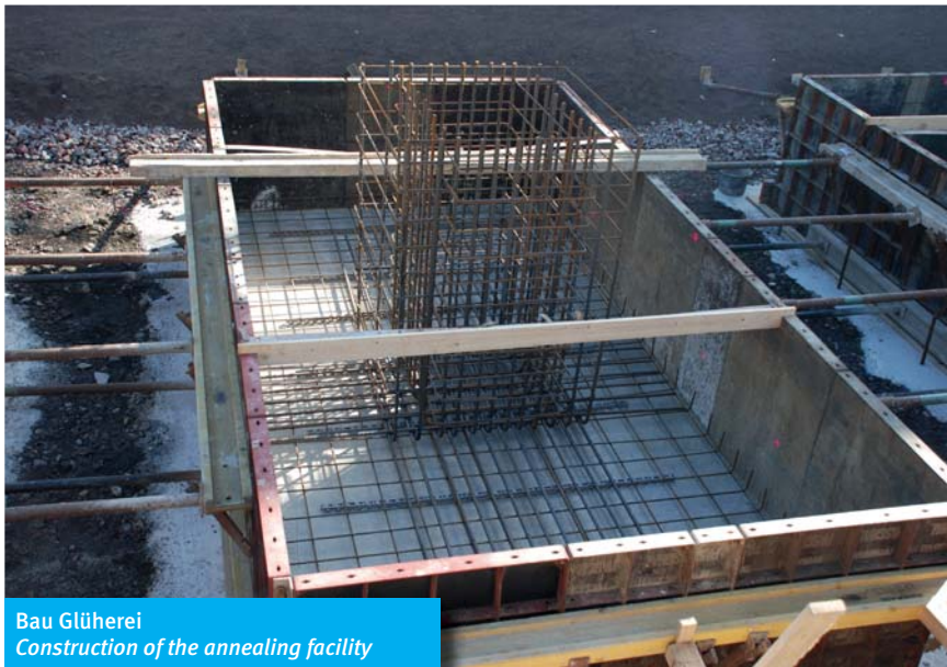
Bau Glüherei Construction of the annealing facility